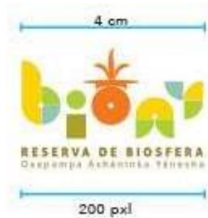
Logotipo según identidad manual BIOAY